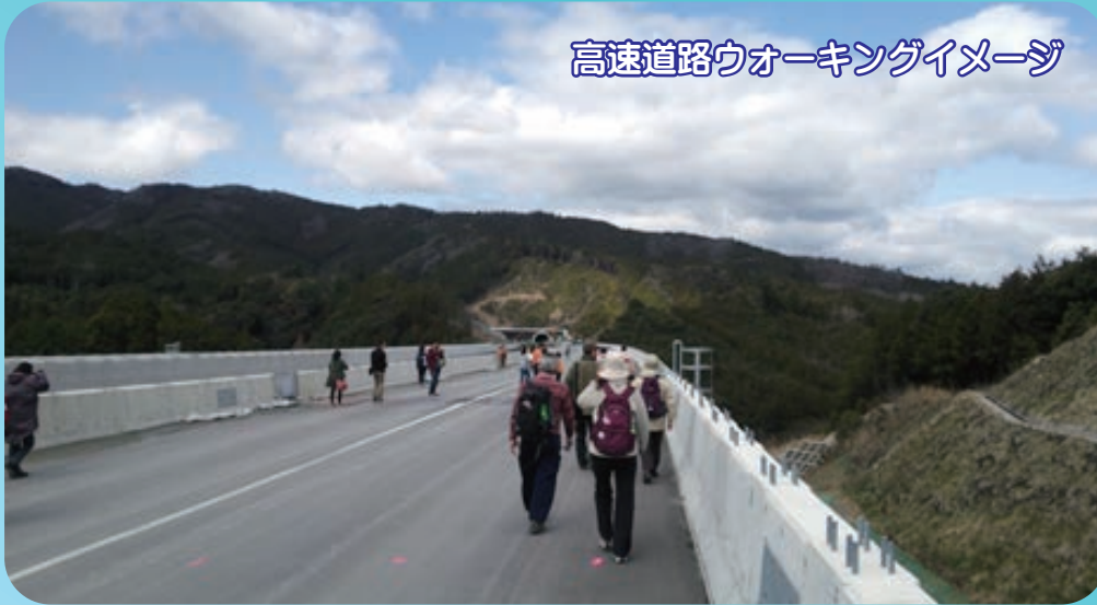
高速道路ウォーキングイメージ