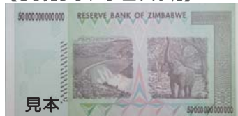
(カリバダム：ジンバブエ共和国)