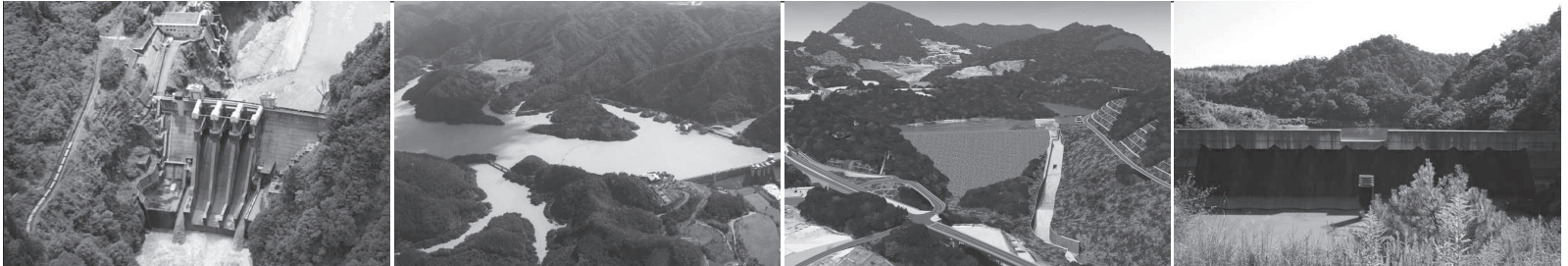
(表画)「天ヶ瀬ダム」(裏画)左から「出し平ダム」「日吉ダム」「安威川ダム(イメージパース)」「農業公園スチールダム」

日時：2014年9月11日(木) 18:00～21:00 (開場：17:45) 土木学会全国大会(大阪大学)の中日 会場：CAFE Lab.(カフェ・ラボ) 大阪駅 グランフロント大阪 北館1F 参加費：2,000円/人(フリードリンク、軽食)