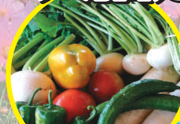
飯南高原野菜 1年分 3名様