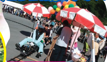
ミニ列車乗車券 1回 200円