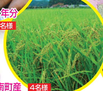
飯南町産 4名様 新米コシヒカリ 半年分