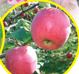
赤来高原りんご 1年分 5名様