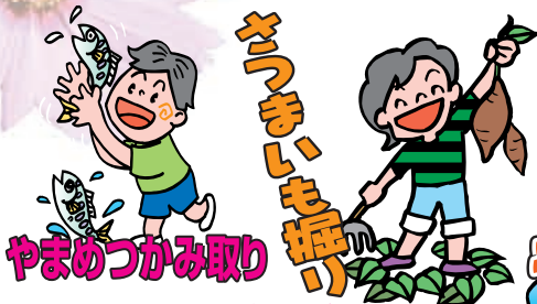
やまめつかみ取り